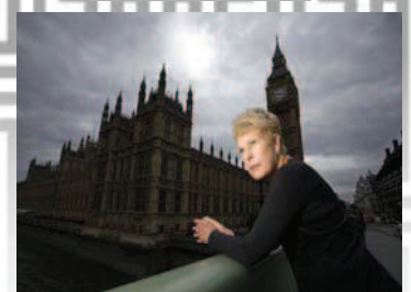
BARBARA VINE-RUTH RENDELL