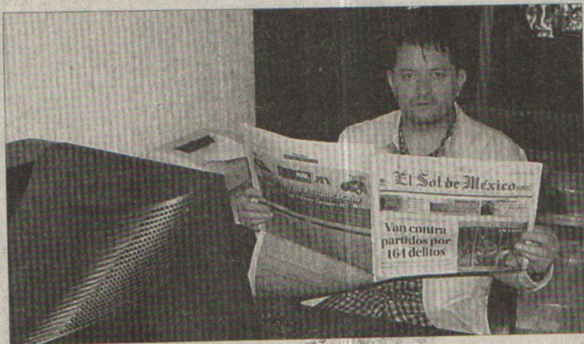
» EL ESCRITOR es un psicoterapeuta reconocido.

"Cuando yo escribí, lo hice para mí. No me imaginé que tuviera tanto éxito y me-