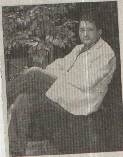
» EL AUTOR durante su visita a El Sol de México.

Un profesional clínico, una noche recibe una llamada para que atienda de emergencia a un pequeño. En un edificio lúgubre, que apenas si reconoce, se encuentra a un pequeño que tiene un parecido a él. La intriga llega cuando se da cuenta que comparten el mismo nombre. El lugar ya no parece real, el miedo comienza a invadirlo y la historia se desencadena.