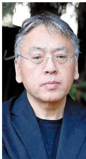
Kazuo Ishiguro

En 1995 fue nombrado Oficial de la Orden del Imperio Británico, y, en 1998, Caballero de las Artes y las Letras por el gobierno francés. Su obra fue tra-