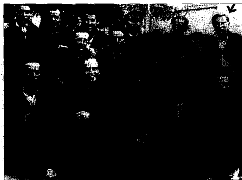
Con sus compañeros de cautiverio, en el penal de Burgos (1950).

años. Tenía 41. Nunca creyó que aquel ansiado sueño pudiera ser doloroso. Durante meses, soportó problemas en sus ojos por la luz natural; sufrió náuseas y vó-