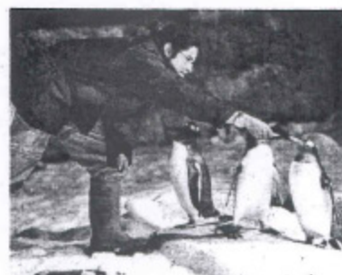
Los pingüinos se alimentan.

Faunia Noche en el Polo Sur. Faunia, el parque temático de la Naturaleza, ha organizado una velada para que los más pequeños descubran los secretos de la Antártida rodeados de pingüinos, mientras descubren su forma de vida y todas sus curiosidades. La cita será el próximo viernes 8 de mayo, donde los asistentes recibirán una visita guiada, realizarán diferentes actividades y pasarán la noche en sacos de dormir dentro del ecosistema de los Polos junto a más de 100 pingüinos. El precio es de 54 euros con desayuno, cena y actividades, todo incluido.