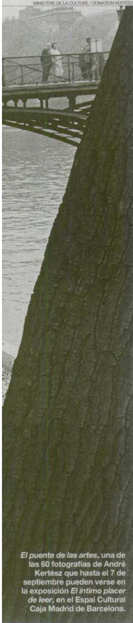
El puente de las artes, una de las 60 fotografías de André Kertész que hasta el 7 de septiembre pueden verse en la exposición El íntimo placer de leer , en el Espai Cultural Caja Madrid de Barcelona.

Ruiz Zafón, ha incorporado al universo del Cementerio de los Libros Olvidados al escritor David Martín y su novela La ciudad de los malditos . Y no en un camposanto, sino en la más célebre de las bibliotecas cifra Steve Berry el enigma de La conexión Alejandra (Seix Barral), donde el agente Malone encabeza una intriga en torno al destino de los manuscritos alejandrinos.