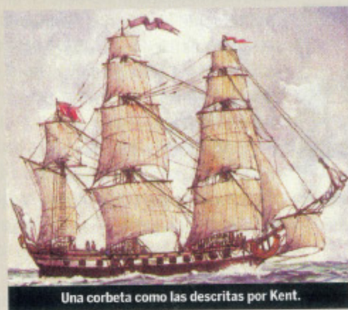
Una corbeta como las descritas por Kent.

Dos nuevas entregas de las peripecias marítimas del carismático vicealmirante Richard Bolitho creado por Alexander Kent.