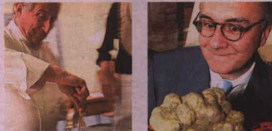
Michel Guérard y Alain Ducasse, dos de los grandes chefs franceses y símbolos vivos de la decadencia culinaria en el país vecino.

Francia ha perdido su puesto como capital culinaria. Las cocinas más reputadas se encuentran ahora en Nueva York, Londres y, por supuesto, en España