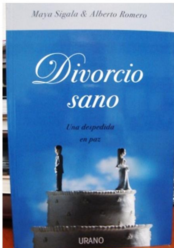
TRIVIA Participa y gana un ejemplar de Divorcio sano . Una despedida en paz

Los ganadores de la trivía serán notificados por medio de