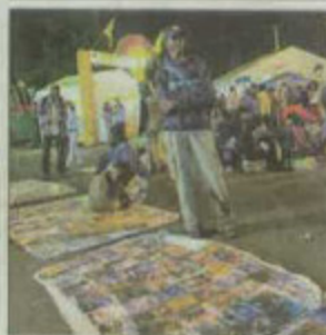
‘Top manta’, en el recinto.