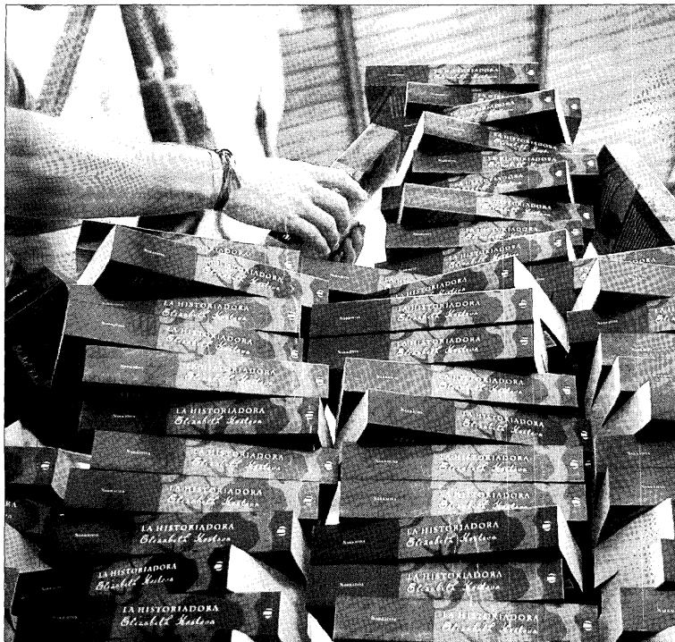
► Pilas de ejemplares de La historiadora en el almacén de la editorial Umbriel.