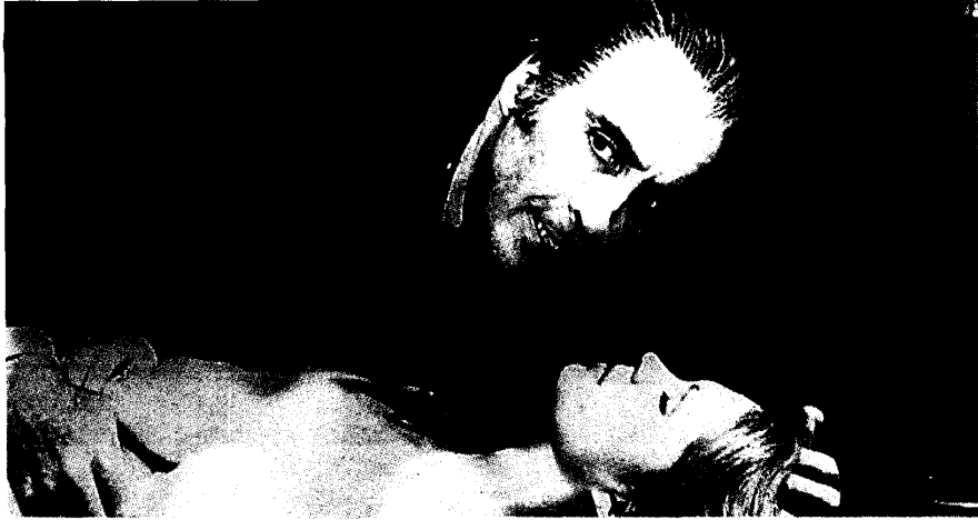
Christopher Lee, en un fotograma de 'El conde Drácula'.