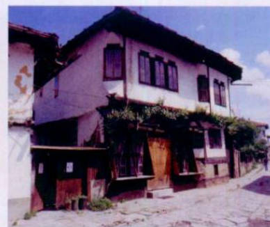
Tryavna, aldea búlgara.