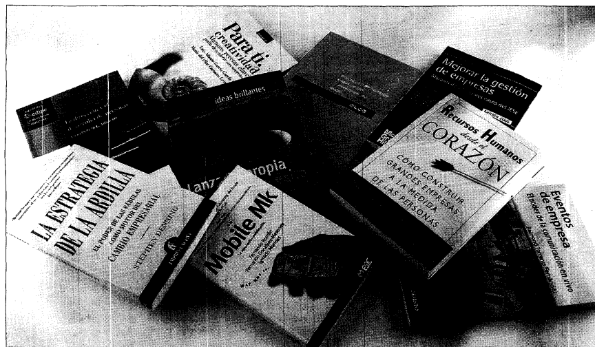
El marketing, el cambio, los recursos humanos o la creatividad son algunos de los temas escogidos por las editoriales para sus nuevas publicaciones.

Los relatos y las parábolas son una de las herramientas más poderosas para cambiar o reforzar la cultura de una organización. El autor demuestra cómo aplicarlos para hacer