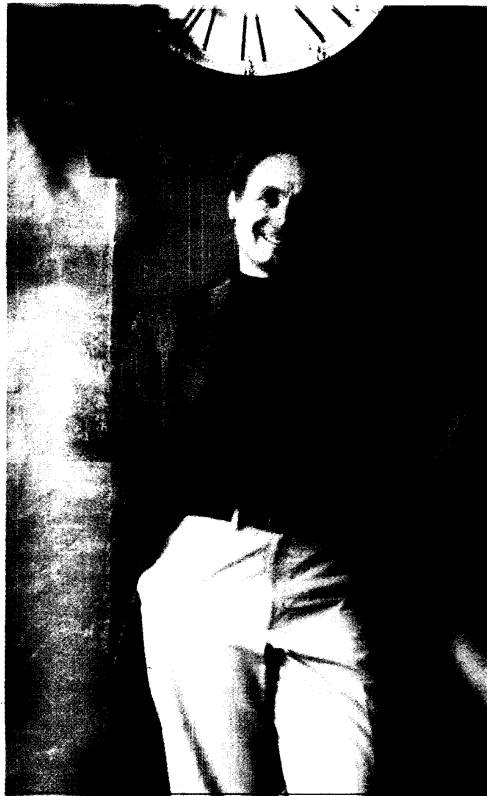
AUTOR. Dan Brown, en una imagen reciente.

Lo sorprendente de Dan Brown, lo fascinante de su éxito, es que ha conseguido vender millones de libros con una literatura científica, divulgativa, cargada de tecnicismos e ingeniería de vanguardia, que sólo habíamos encontrado en viejas publicaciones como Mundo científico o National Geographic . Si usted pone a leer estas revistas a la muchedumbre atónita que devoró El código Da Vinci , es muy probable que lo despachen con un discreto gesto de desprecio. Pero entonces llega Dan Brown, y empieza a hablar de Carbono 14, espectrografía de masas, aviones invisibles y aceleradores de partículas, y he aquí que nos quedamos estupefactos, inmóviles, anonadados, esperando la solución definitiva a