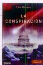
La conspiración Dan Brown Umbriel 608 págs. 18 €.

y que los lectores que usamos el transporte público vamos a seguir viendo sus libros no sólo en los escaparates de las librerías, sino también abierto de par en par en las manos de muchas de las personas que a diario tenemos al lado a lo largo de nuestro itinerario. ■