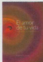
EL AMOR DE TU VIDA Enriqueta Olivari. Shantidasi Ed. Bubok autoedición

Tenemos la suerte de que cada año este hombre se acerca a Mallorca a compartir con sus amigos, historias y experiencias. Da gusto escucharle. Y leerle.